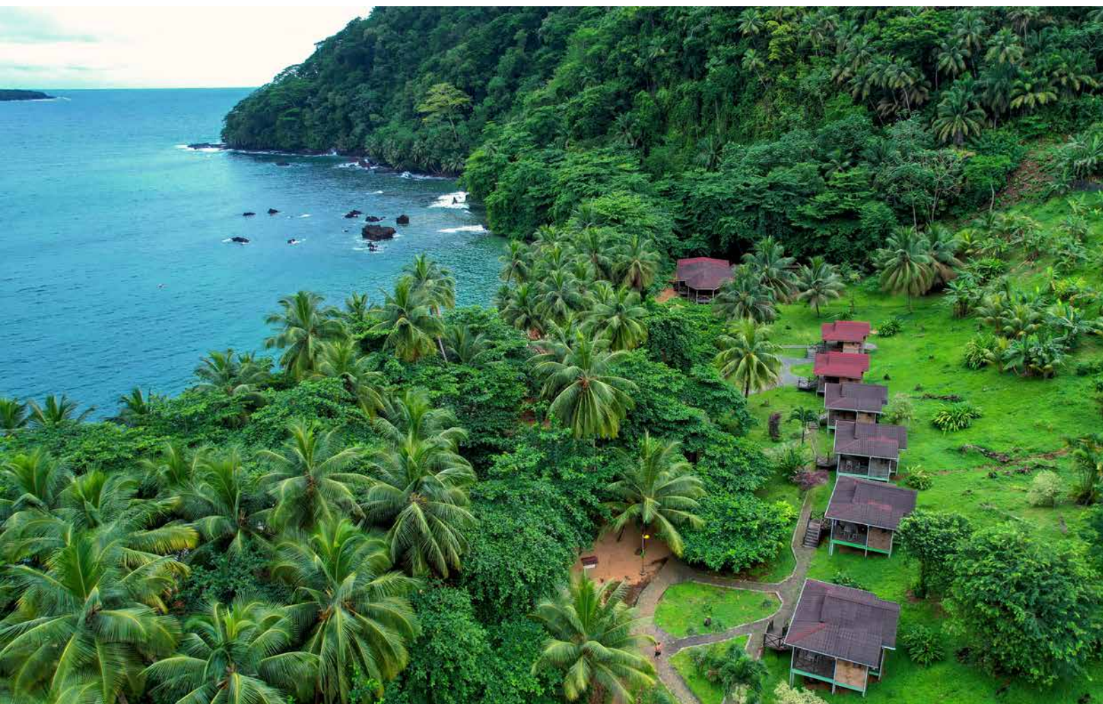
Eco Lodge di Praia Inhame

Nella nostra proposta abbiamo scelto di includere i voli di Tap Portugal che, ad oggi, garantisce i migliori operativi per le date previste. Trattandosi di alta stagione suggeriamo a chi fosse interessato a prendere parte al tour, di confermare quanto prima la propria iscrizione per poterci consentire di bloccare il volo e non rischiare che si esauriscano le disponibilità garantite dalle compagnie aeree.